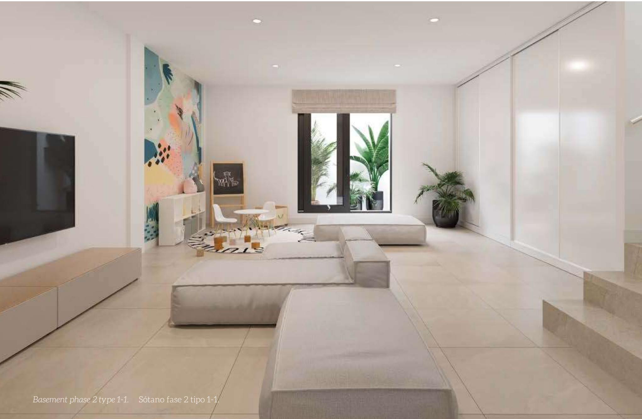
Basement phase 2 type 1-1. Sótano fase 2 tipo 1-1.