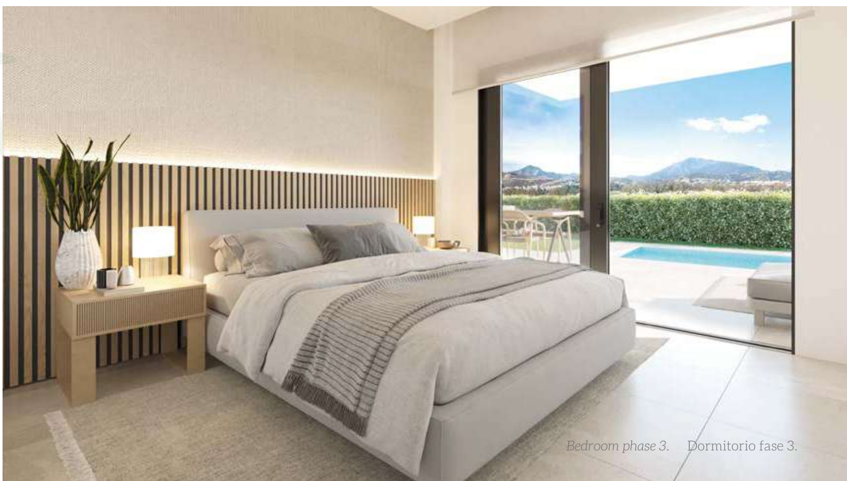
Bedroom phase 3. Dormitorio fase 3.