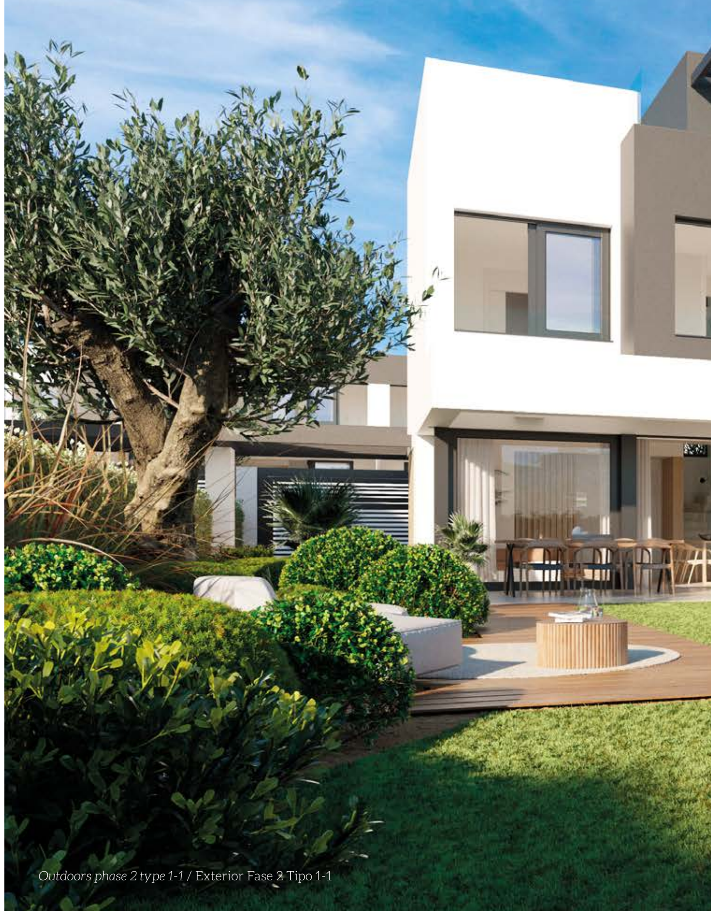
Outdoors phase 2 type 1-1 / Exterior Fase 2 Tipo 1-1