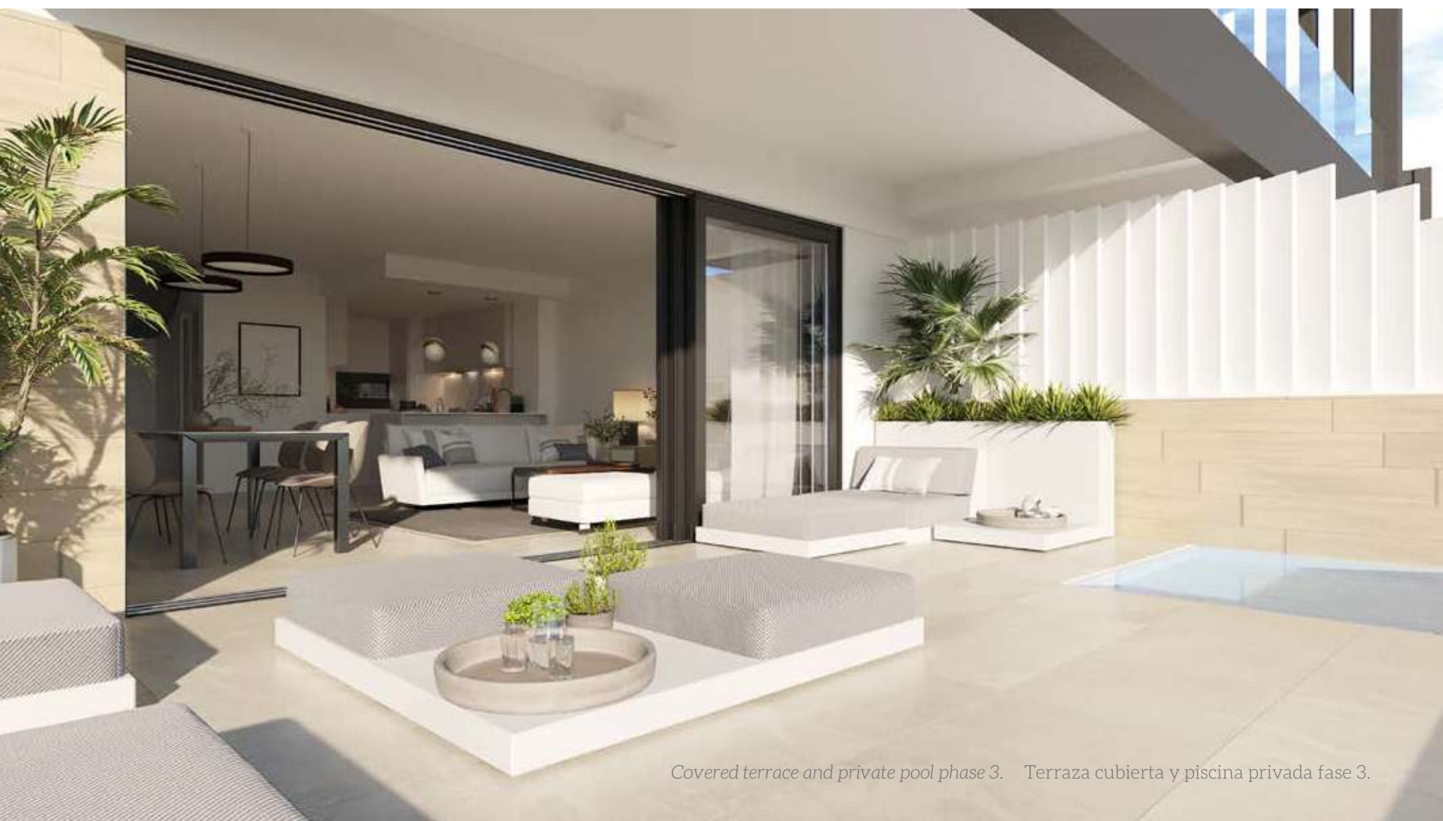
Covered terrace and private pool phase 3. Terraza cubierta y piscina privada fase 3.