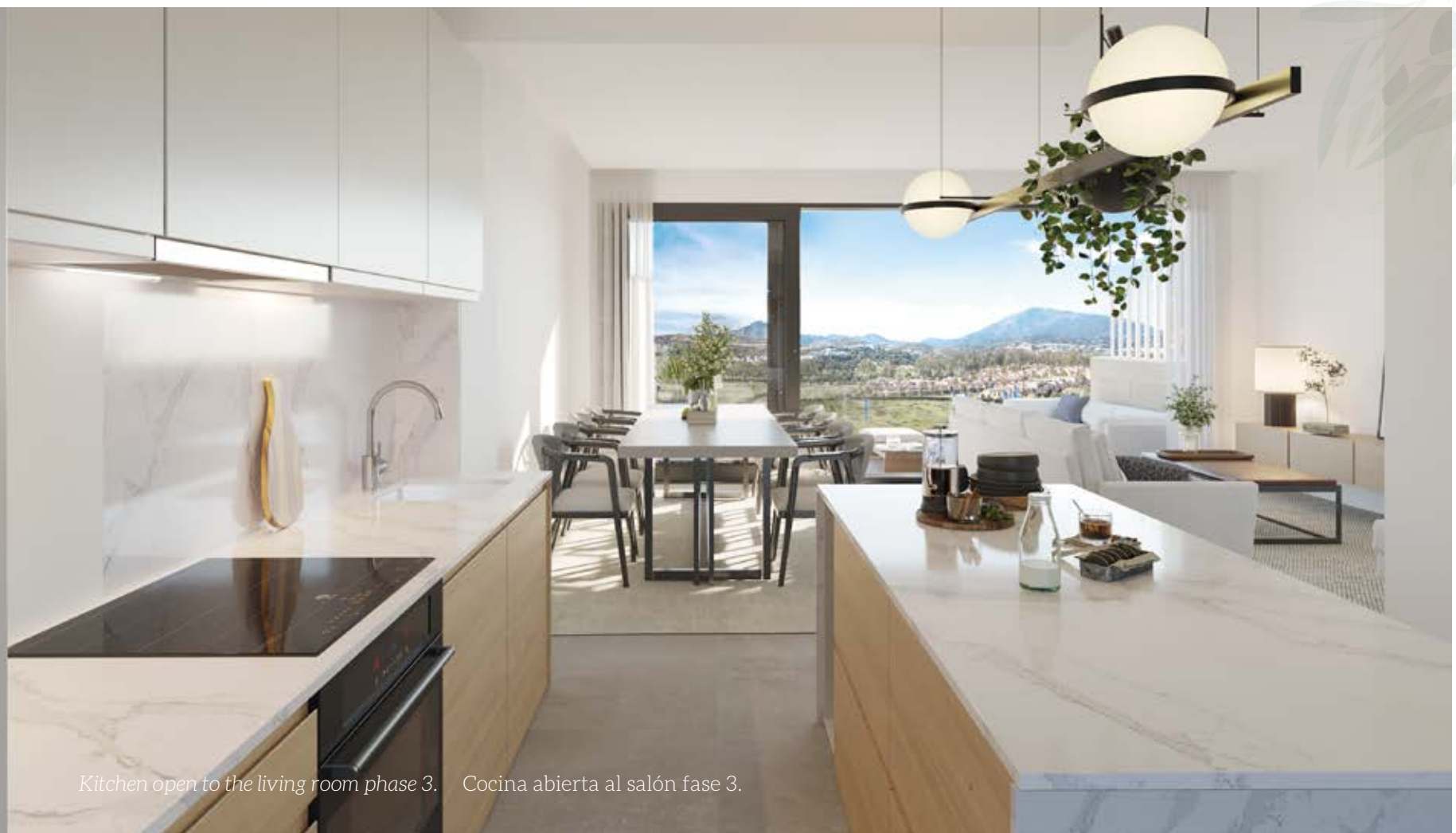
Kitchen open to the living room phase 3. Cocina abierta al salón fase 3.