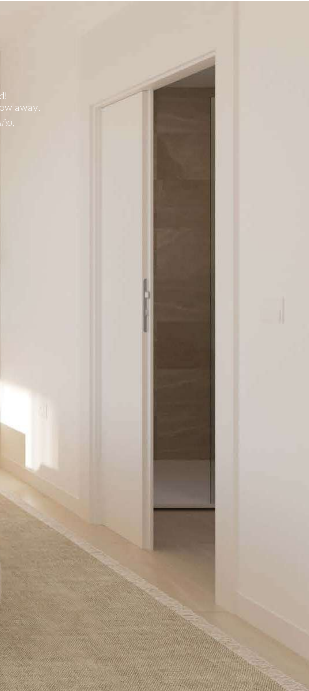
Main bedroom phase 2 type 1-1 / Dormitorio principal fase 2 tipo 1-1