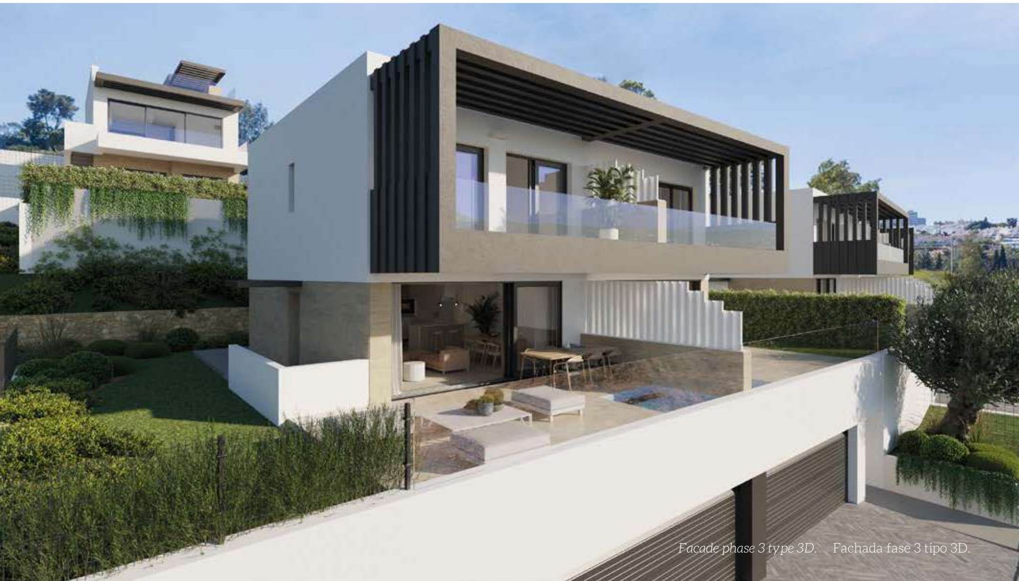
Facade phase 3 type 3D. Fachada fase 3 tipo 3D.