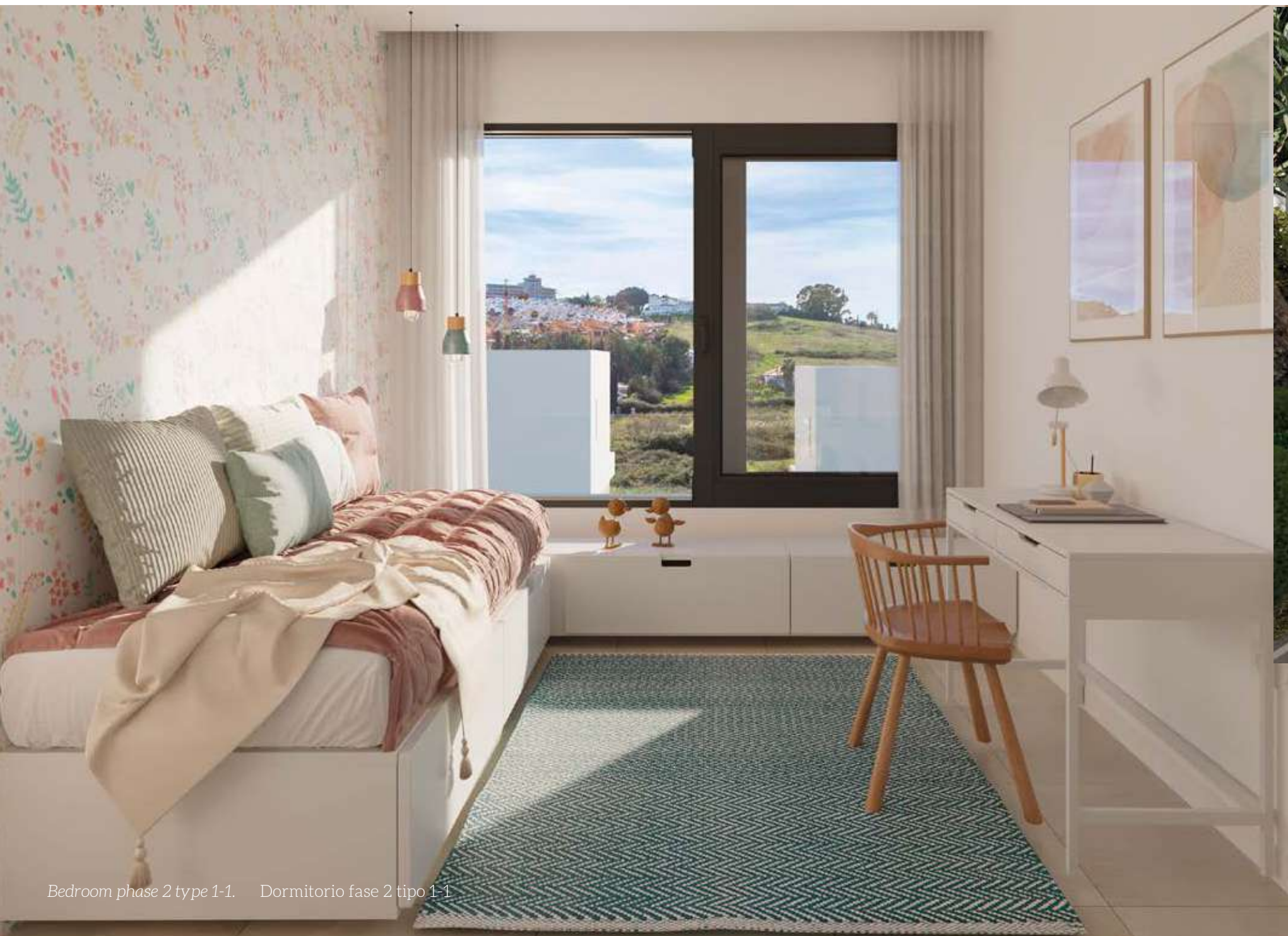
Bedroom phase 2 type 1-1. Dormitorio fase 2 tipo 1-1