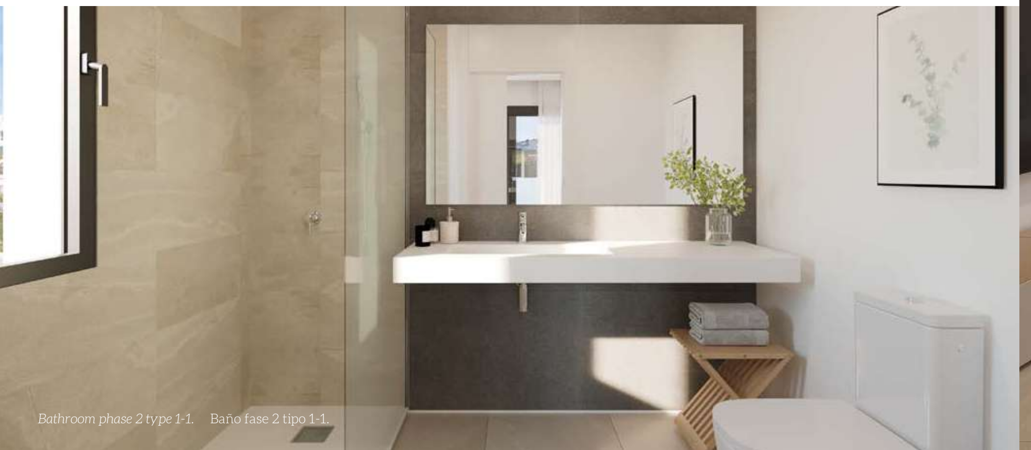
Bathroom phase 2 type 1-1. Baño fase 2 tipo 1-1.